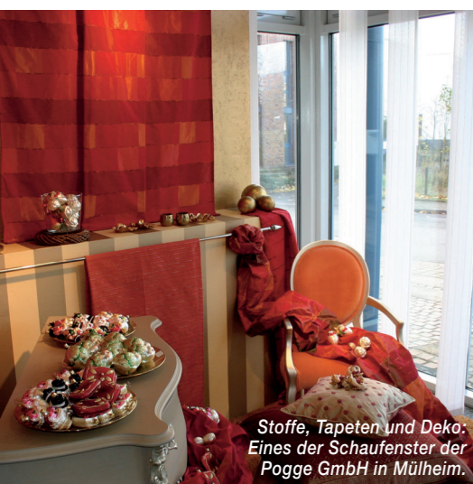
Stoffe, Tapeten und Deko: Eines der Schaufenster der Pogge GmbH in Mülheim.

gnierte Vorsitzende: „Wir müssen die Scheuklappen ablegen und auf andere Verbände zugehen. Wir, nicht die anderen, weil wir ein kleiner Verband sind. Bereits die nächste Hauptversammlung in Bad Brückenau am 11. und 12. Mai 2007 wird gemeinsam mit dem Zentralverband Parkett und Fußbodentechnik und dem BEB, dem Bundesverband Estrich und Belag, stattfinden. Es wird nur so gehen.“