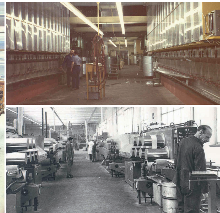
Links: Filamentproduktion im Werk Bobingen in den sechziger Jahren. Die beiden Bilder rechts zeigen die Trevira-Faserproduktion 1961.

gut wie jedes Gesicht annehmen, vom Möbelstoff über die Gardine bis zum Abendkleid. In den fünfziger Jahren stand der Begriff Trevira vor allem für bügelfreie Oberbekleidung (Werbeprospekt: „Trevira schenkt beim Tragen Wohlbehagen“), aber auch für Sicherheitsgurte („Die Lebensversicherung für Autofahrer“).