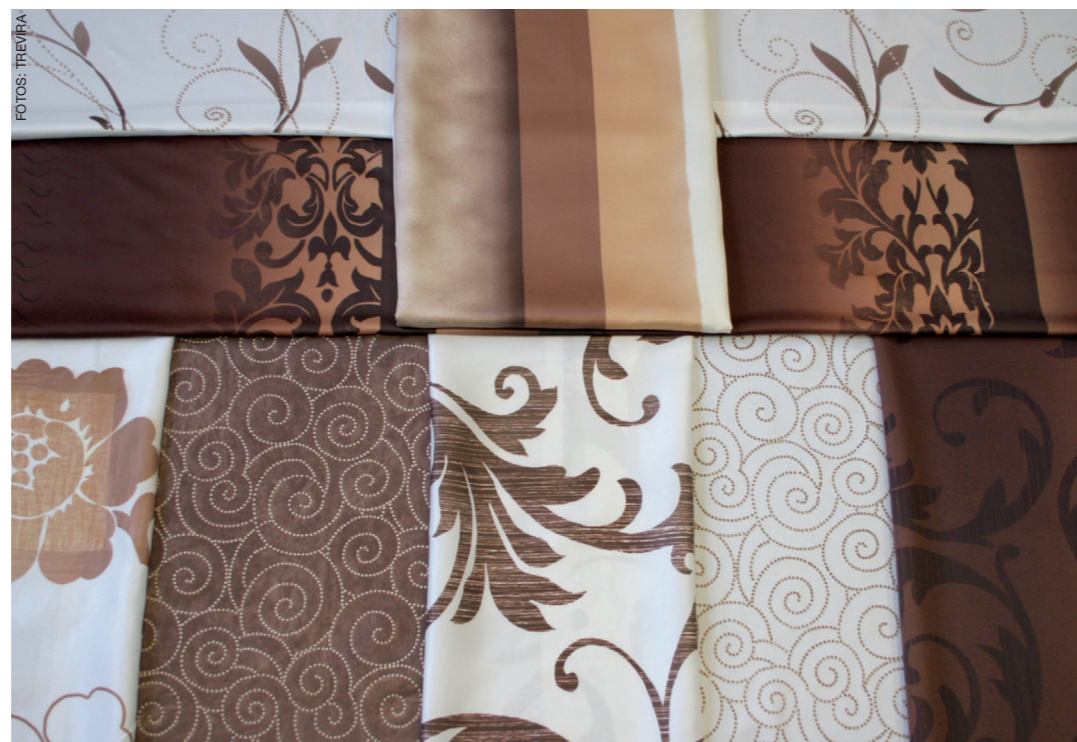
Mit Mantel und Hut: Trevira-Werbung aus den fünfziger Jahren. Die aktuelle Contract-Kollektion (rechts) wurde in Zusammenarbeit mit Transfertex entwickelt.