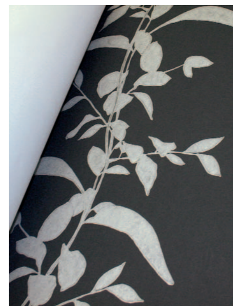
Metallenes Rankenmuster auf mattem Fond: eine Leimdrucktapete aus einer neuen Kollektion, die im April in den Handel kommt.