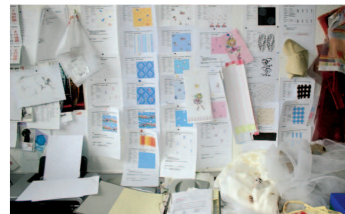
Die Ateliers von Rasch Textil, Kupferoth und Elbersdrucke sind die kreative Keimzelle des Unternehmens.