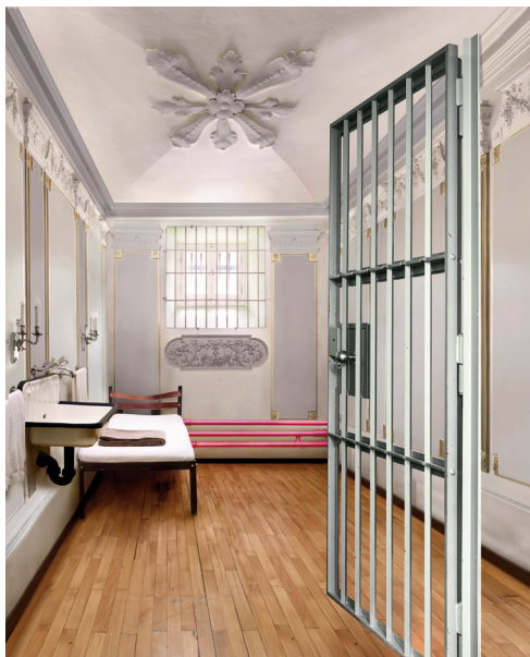
Mit solchen Motiven wirbt der Verband für die Leistungen der Mitglieder. Zum Bild links kommt der Text „Wir machen aus jedem Raum ein Zuhause“ beziehungsweise rechts „Wir haben für jeden Schimmel eine Antwort“.